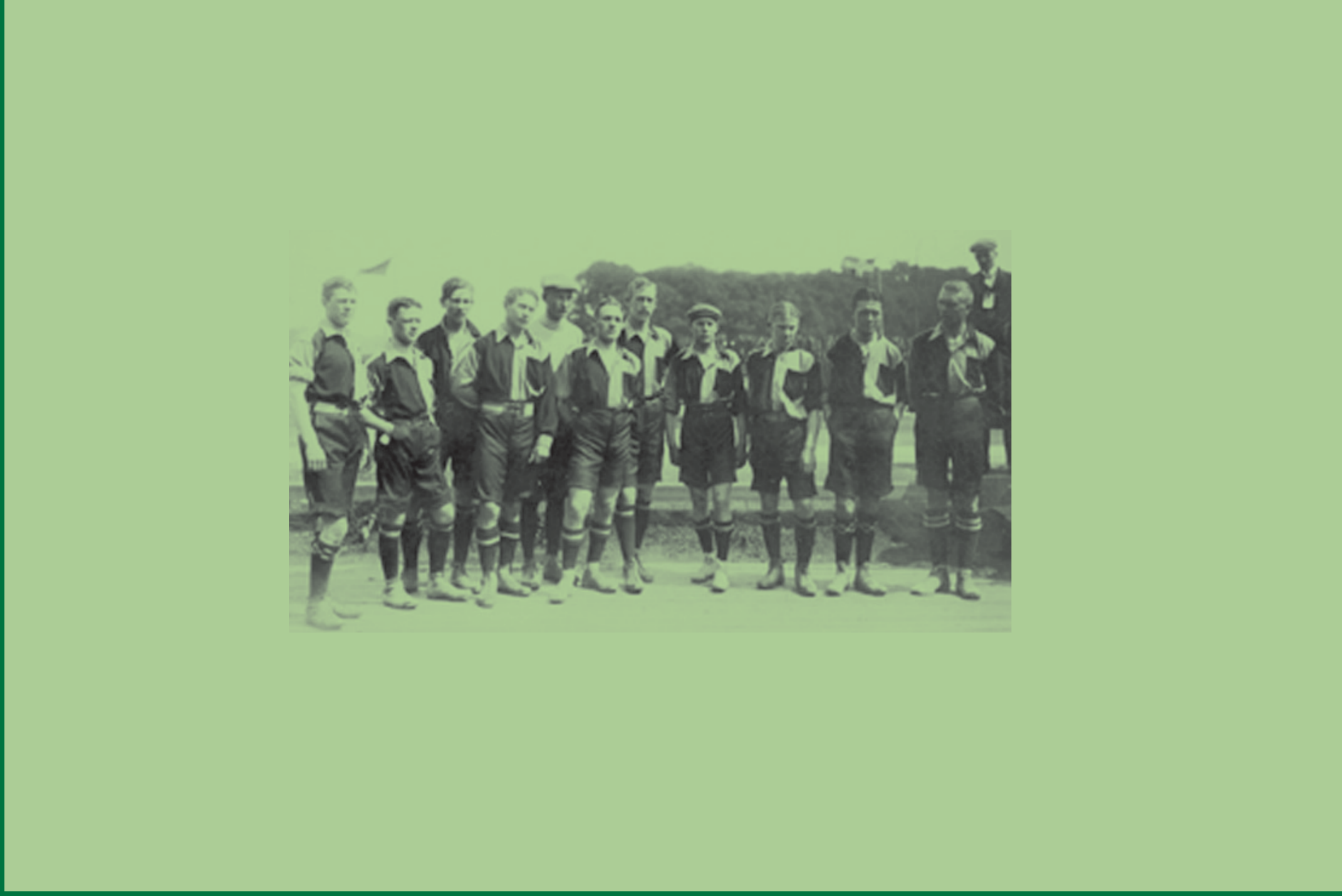
Prva švedska ekipa

Kao društvena igra, uz nova pravila koja u igru uvode red, fair play i novi entuzijazam, igra početkom XX. stoljeća prelazi kanal i dolazi u Europu, gdje je u početku prihvaćena kao aristokratska igra. Primjerice, u Skandinaviji su na stadionu bili razdvojeni gledatelji "viših" i "nižih" klasa.