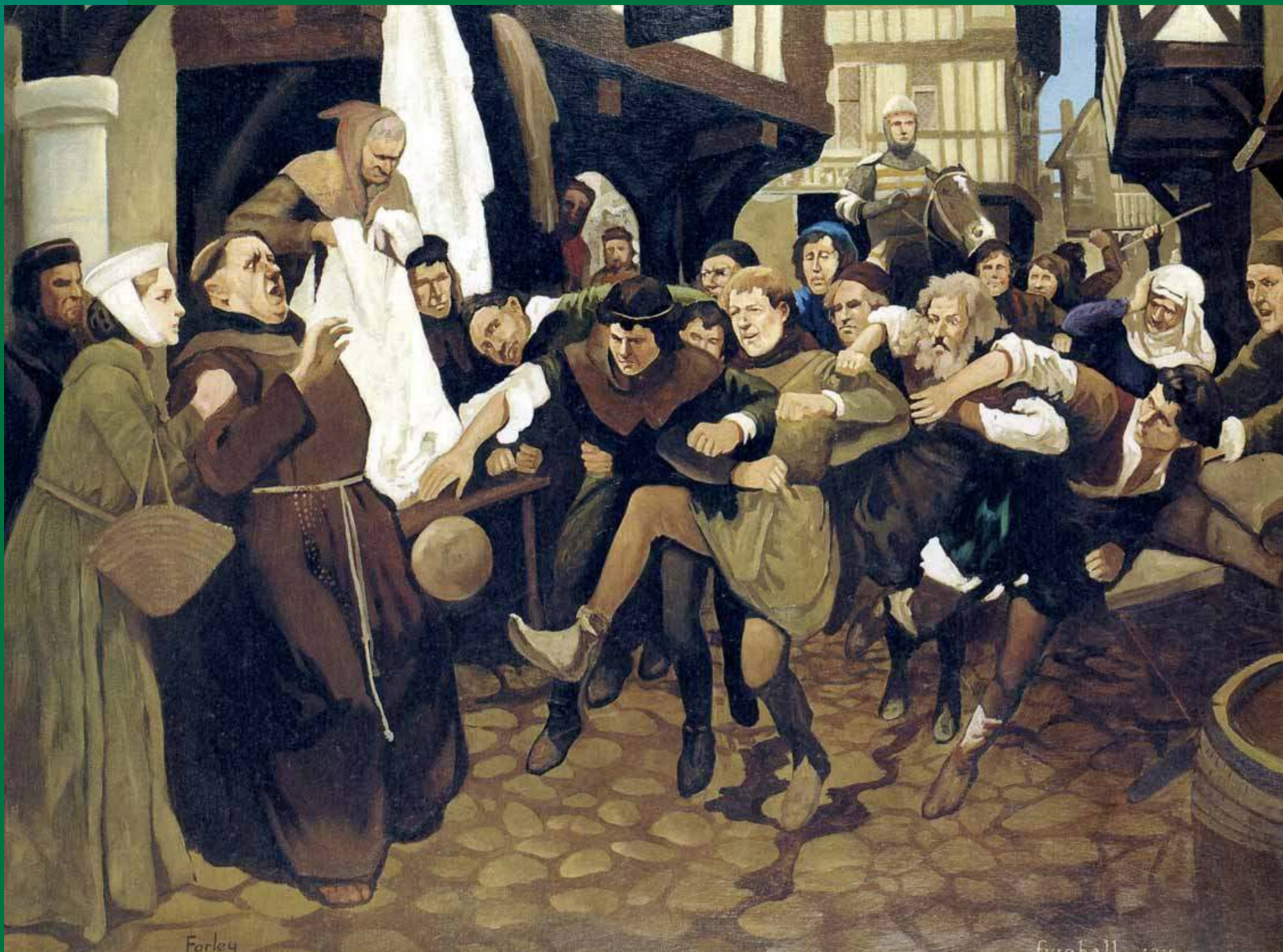
Prikaz igre na ulici

U igri je cilj bio osvojiti prostor koji je bio veličine i po nekoliko kilometara, a igralo se po poljima i ulicama. Igra se, uglavnom, koristila za „sređivanje“ neriješenih imovinskih ili osobnih odnosa, a bitno su joj obilježje bile - nasilnost i okrutnost zbog čega su je često zabranjivali. Prvi pisani trag o zabrani igranja zabilježen je 1314. godine kad je londonski gradonačelnik uz odobrenje kralja zabranio igru loptom.