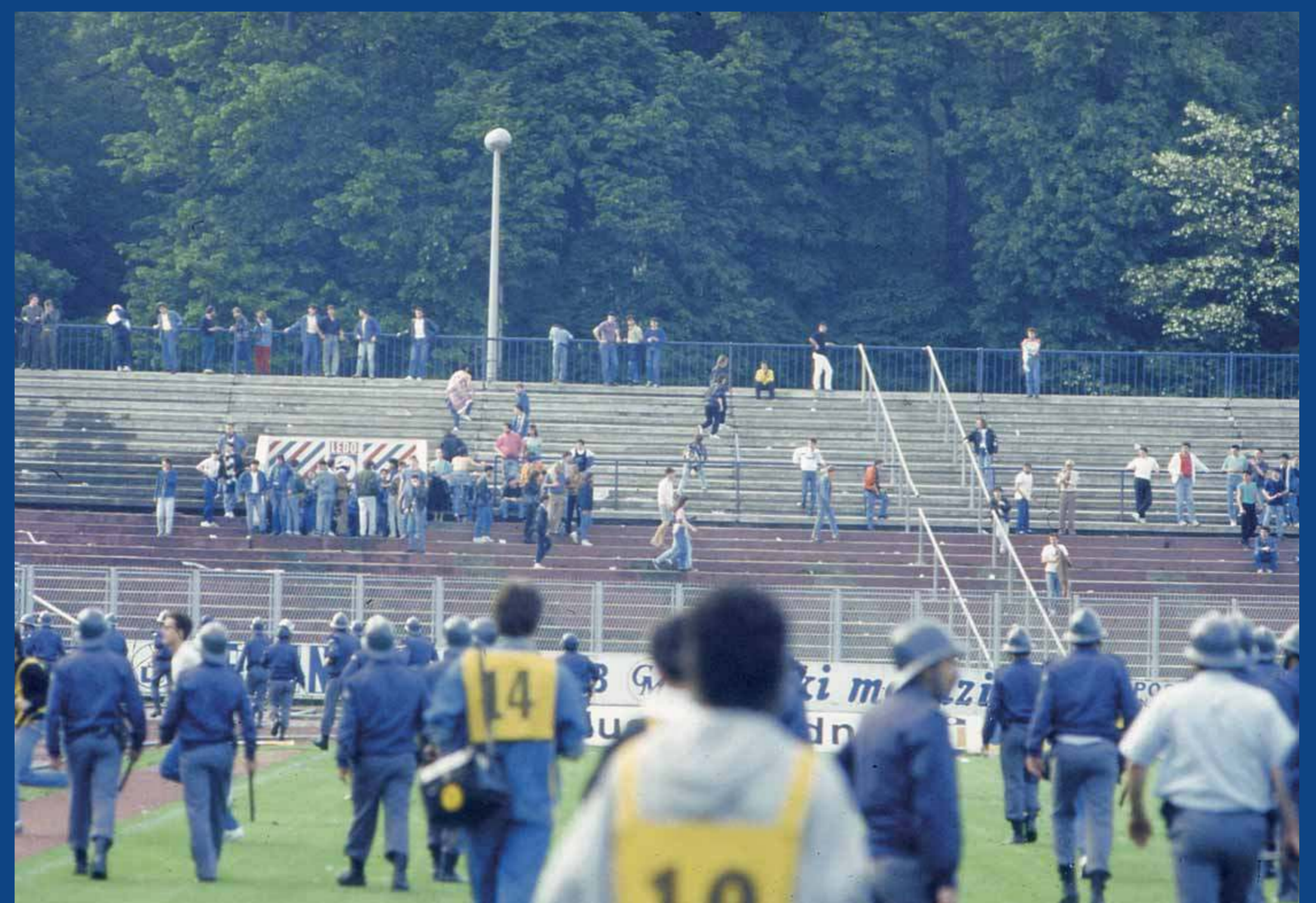
Nered na stadionu u Maksimiru, kraj XX stoljeća.

Svrha je svih poduzetih mjera ustvrditi moguća mjesta izgreda te moguća rizična ponašanja gledatelja, prepoznati rizične osobe pa na vrijeme poduzeti mjere kako bi se izbjegla neželjena ponašanja ili posljedice što više ublažile.