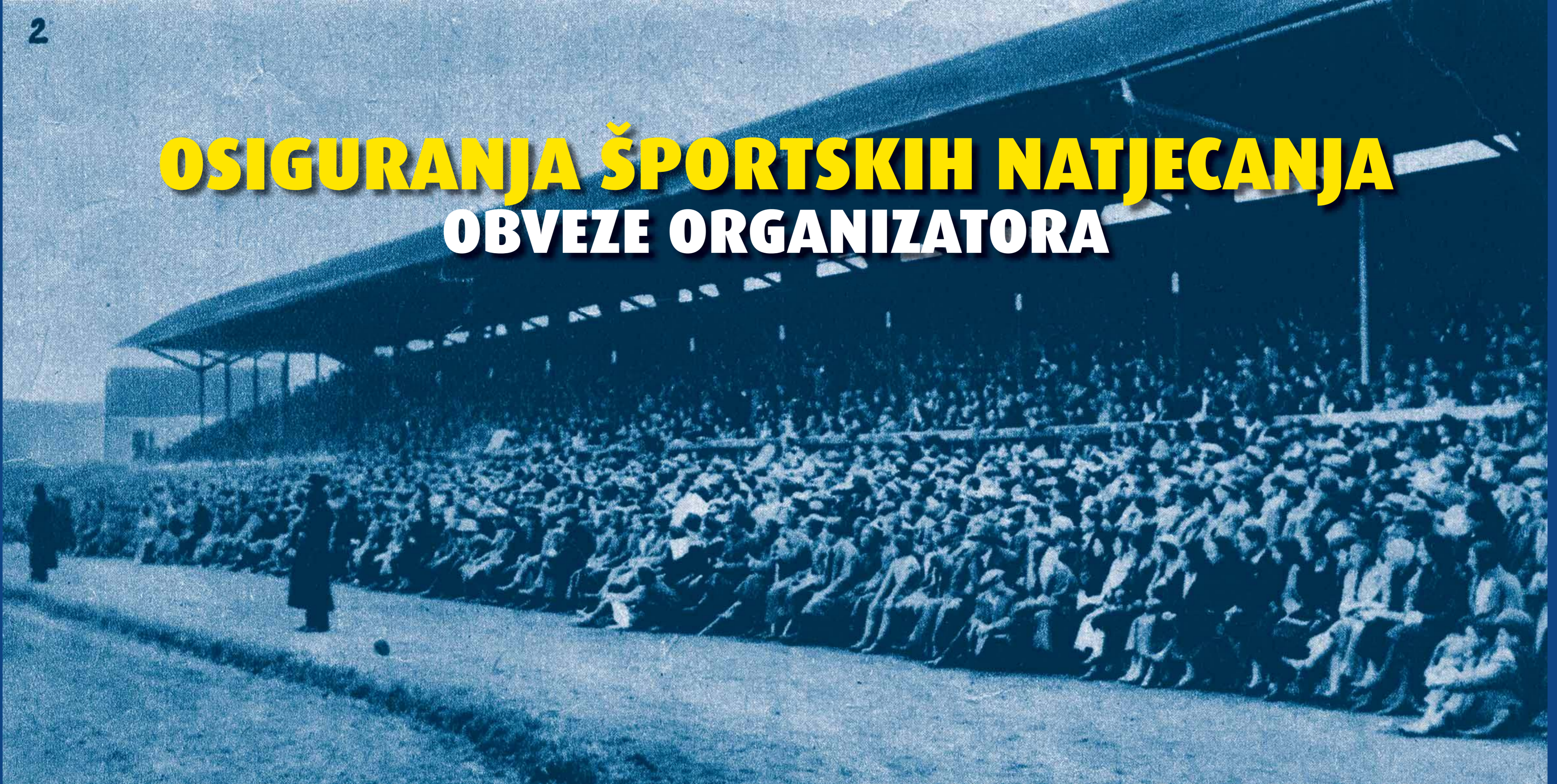
Osiguranje utakmice Concordia - Hajduk, dvadesetih godina XX. stoljeća

Športska natjecanja, a ovdje mislimo na nogomet, postoje zbog gledatelja. Što je značaj susreta veći, više je i gledatelja. Zbog okupljanja većeg broja ljudi u isto vrijeme i na istom mjestu, snage reda u svim državama svojim građanima osiguraju sigurnost i sprječavaju ugrožavanje javnog reda i mira.