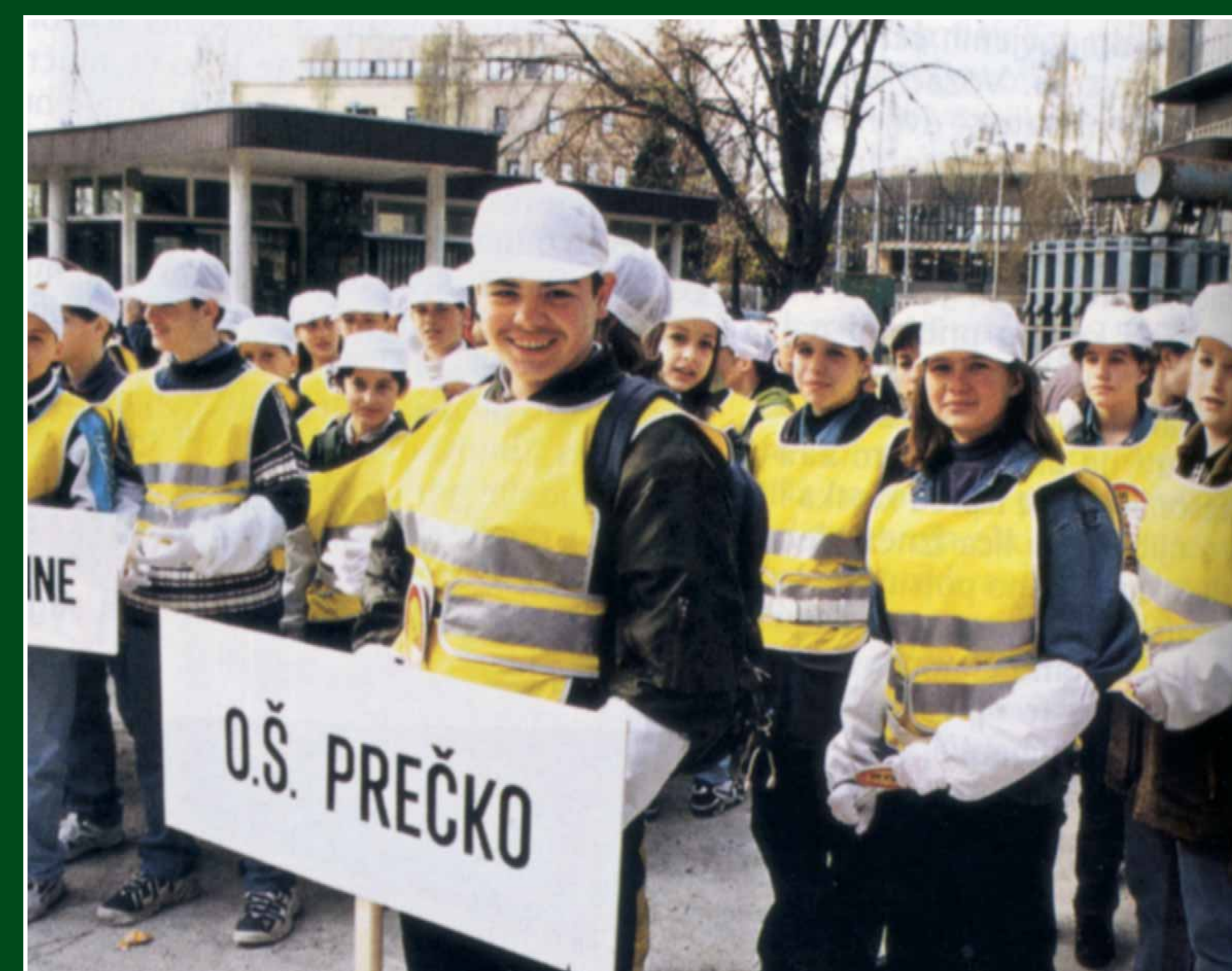
Natjecanje ŠPJ u Zagrebu

Prema dostupnim podacima, prve učeničke prometne jedinice nastale su 1922. godine u SAD-u, točnije u Detroitu (School Safety Patrols) kao jedna od mjera zaštite djece u sve gušćem cestovnom prometu poslije Prvog svjetskog rata. Nakon Drugog svjetskog rata, i u Europi se prema američkom uzoru počinju osnivati školske prometne ophodnje.