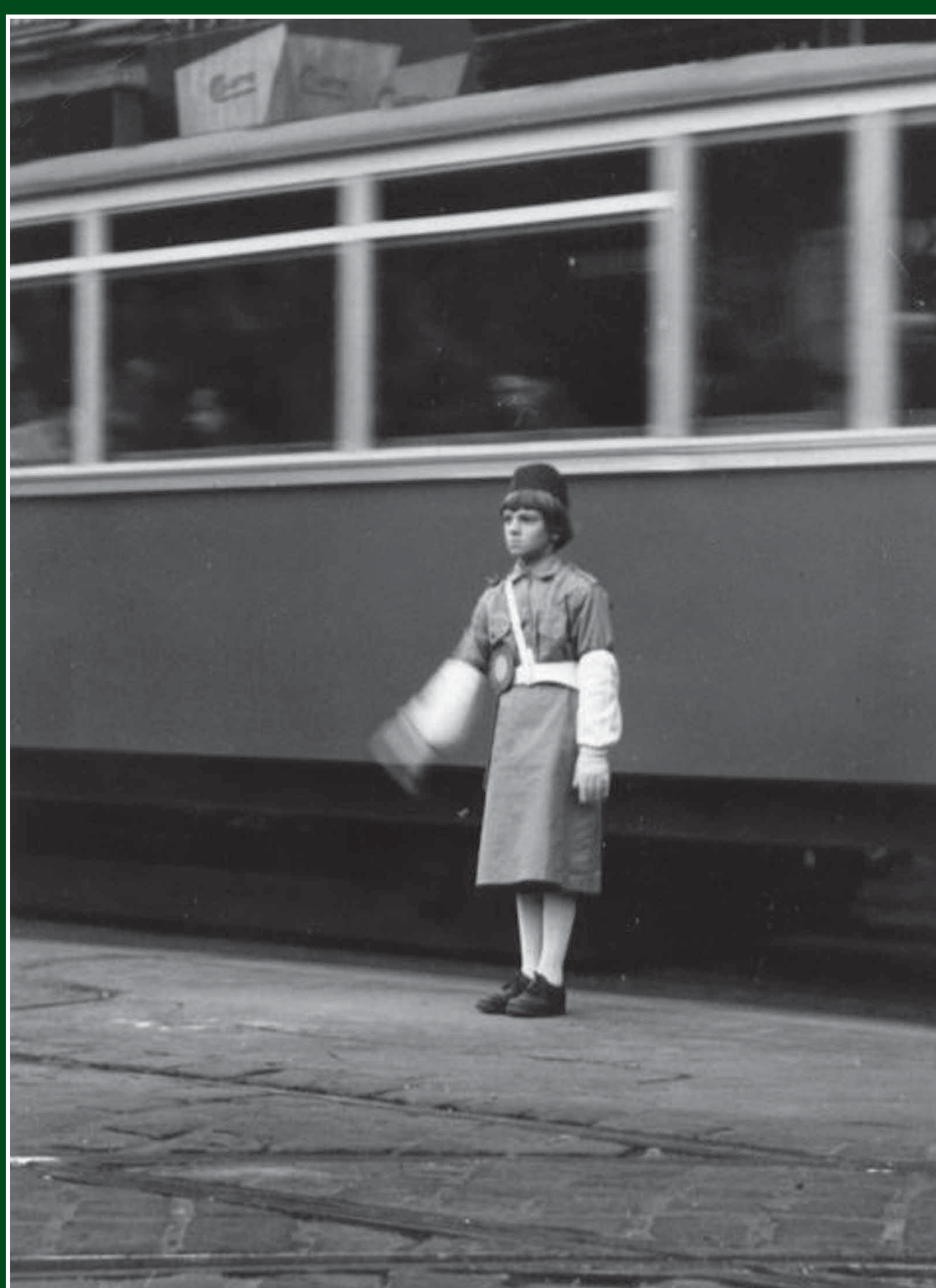
Pripadnica ŠPJ na križanju, 1960. godine

Školske prometne jedinice djeluju u sklopu prometne policije policijske uprave na čijem su području organizirane i pod njezinim su nadzorom. Njihovo opremanje financira lokalna zajednica pa njihova uspostava prije svega ovisi o mogućnostima te zajednice. Zbog toga pripadnici Školske prometne jedinice na prslucima/dijelu službene odore/ nose oznaku grada ili županije koja ih je osnovala.