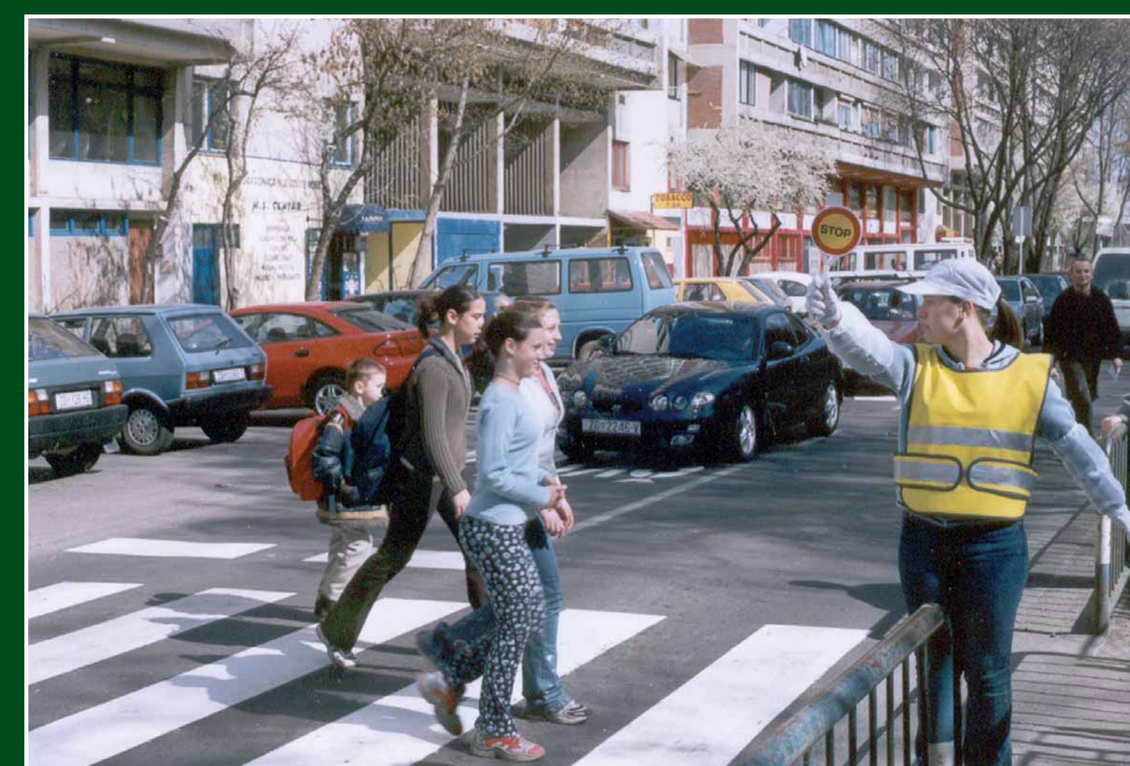
ŠPJ OŠ Jure Kaštelana, Zagreb, 2001. godine

U Hrvatskoj je prva učenička jedinica osnovana u Osnovnoj školi Petrijanec u blizini Varaždina, a slijedile su je mnoge osnovne škole, posebno one koje su se nalazile uz prometnice s intenzivnijim prometom.