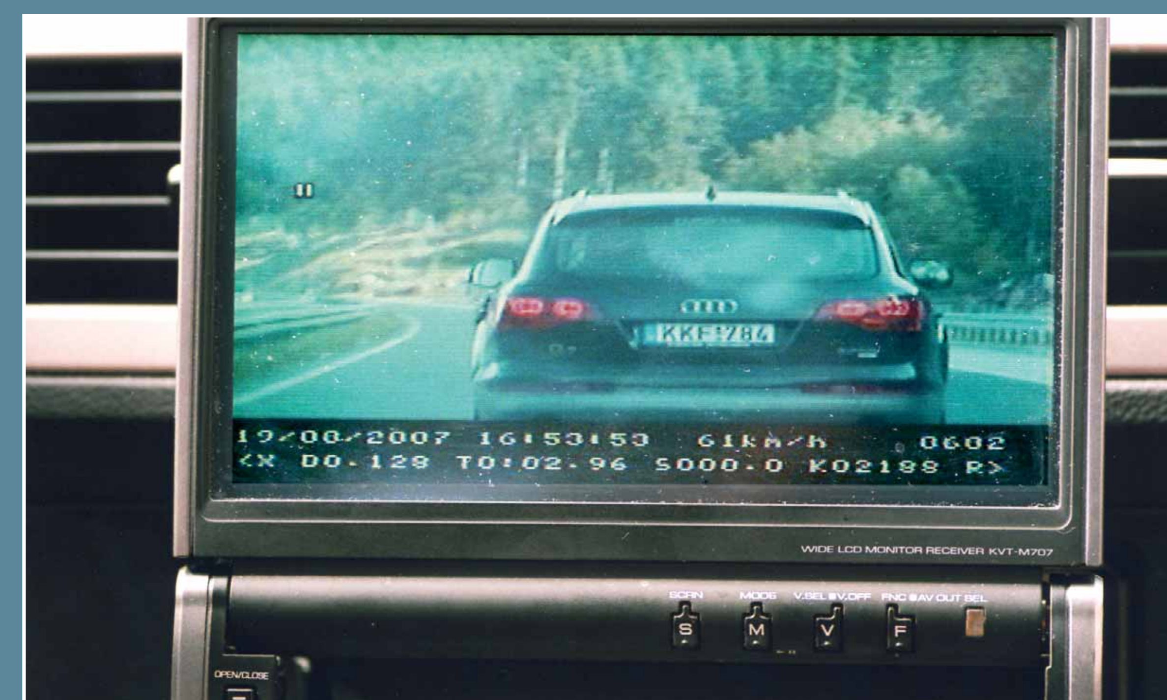
Ekran u policijskom presretaču

„Stop policija“, „Slijedi me“, „Zaustavite vozilo“ ..., poruke su na stražnjoj strani policijskih vozila, svima već poznate kao „presretači“ (iako oni ne presreću već slijede), a kojima prometna policija poziva sudionike u prometu da zaustave svoje vozilo zbog počinjenog prekršaja.