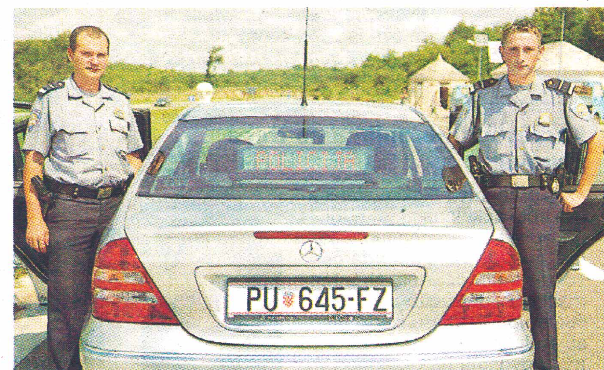
»Mercedes C320 CDI« ima 230 konjskih snaga, a razvija brzinu do 240 kilometara na sat

Od početka godine do 31. lipnja zahvaljujući presretnaču iz Rijeke procesuirano je 306 prometnih prekršaja, a od 1. kolovoza novim je, istarskim presretnačem do 20. kolovoza utvrđen 91 prometni prekršaj