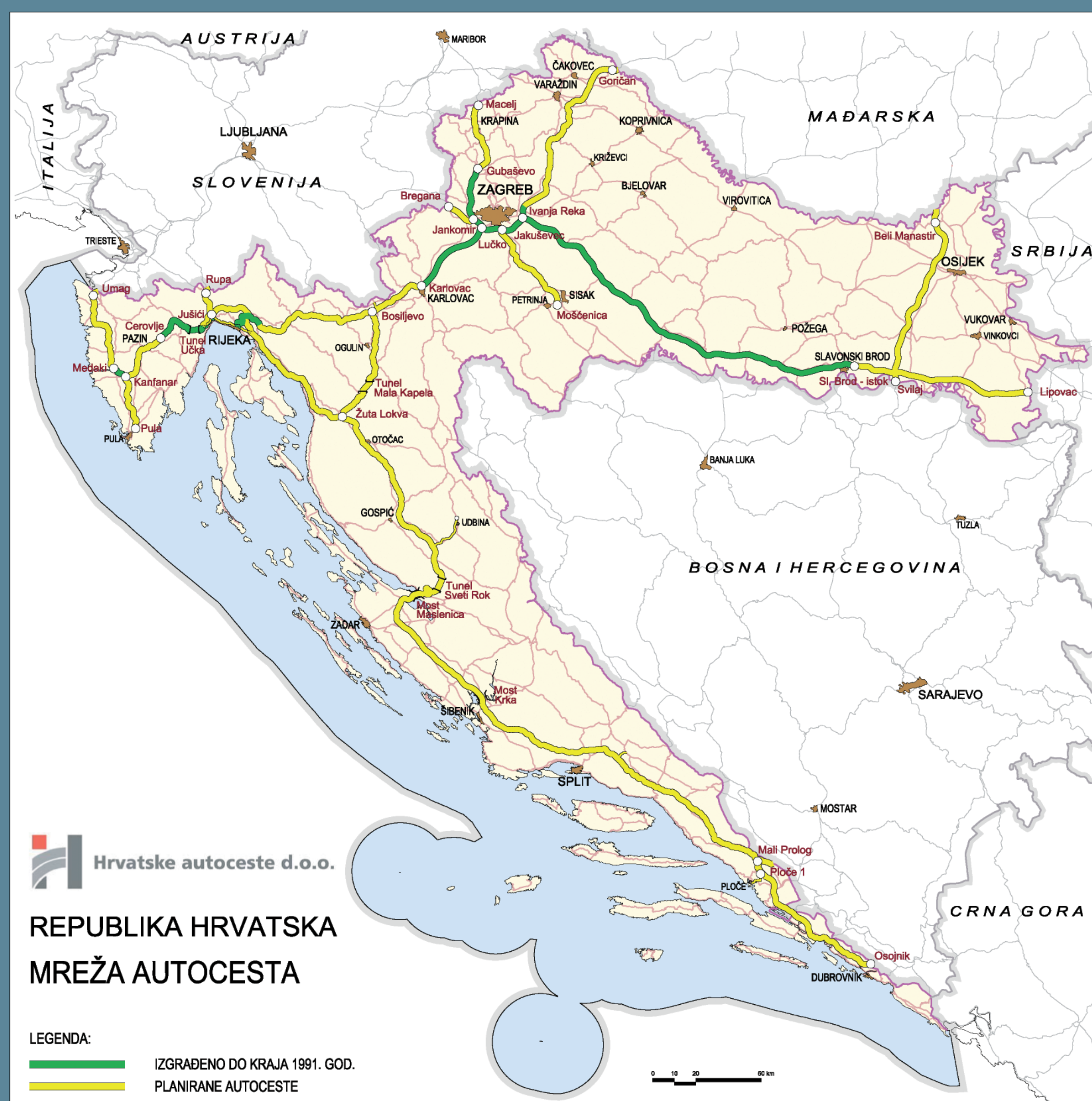
Mreža autocesta Republike Hrvatske do 1991.g.

Osnovna zadaća te Jedinice, kao i današnje Mobilne jedinice prometne policije, bila je nadzor i upravljanje prometom, ali i ostali poslovi iz djelokruga javne sigurnosti. Primjerice, jedinice su bile vrlo uspješne u otkrivačkoj djelatnosti koja se odnosila na otkrivanje i zapljenu ukradenih vozila, ilegalno prebacivanje robe preko granice, otkrivanje i uhićenje osoba za kojima se tragalo, a u vrijeme agresije na Republiku Hrvatsku dale su nemjerljiv doprinos obrani od agresora.