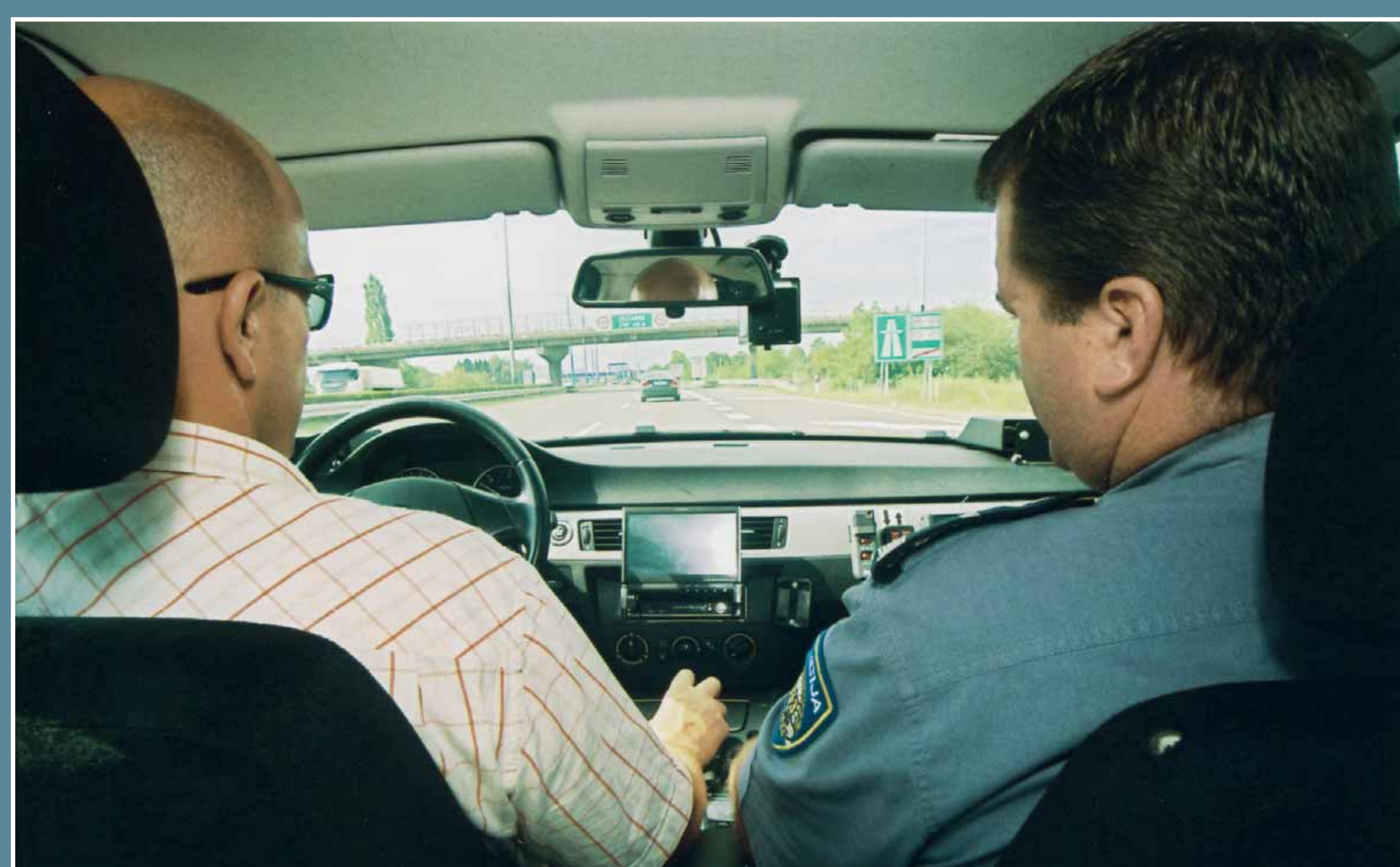
Policijci u policijskom presretaču