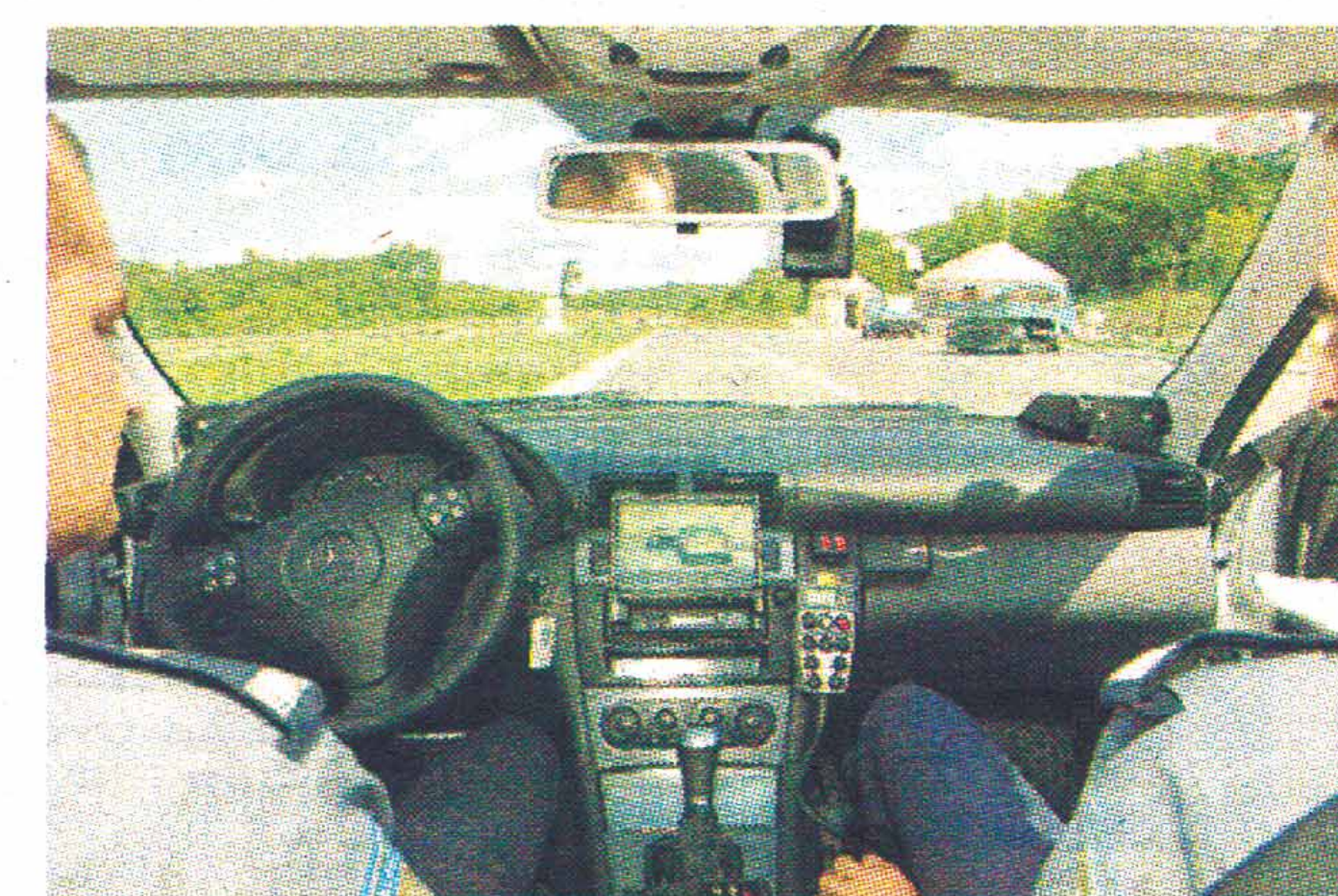
Novom istarskom presretnaču nesavjesni će vozači teško pobjeći

Od početka godine do 31. lipnja zahvaljujući presretnaču iz Rijeke procesuirano je 306 prometnih prekršaja, a od 1. kolovoza novim je, istarskim presretnačem do 20. kolovoza utvrđen 91 prometni prekršaj, od čega 45 prekršaja brzine i 46 drugih prekršaja poput nepropisnog pretje-