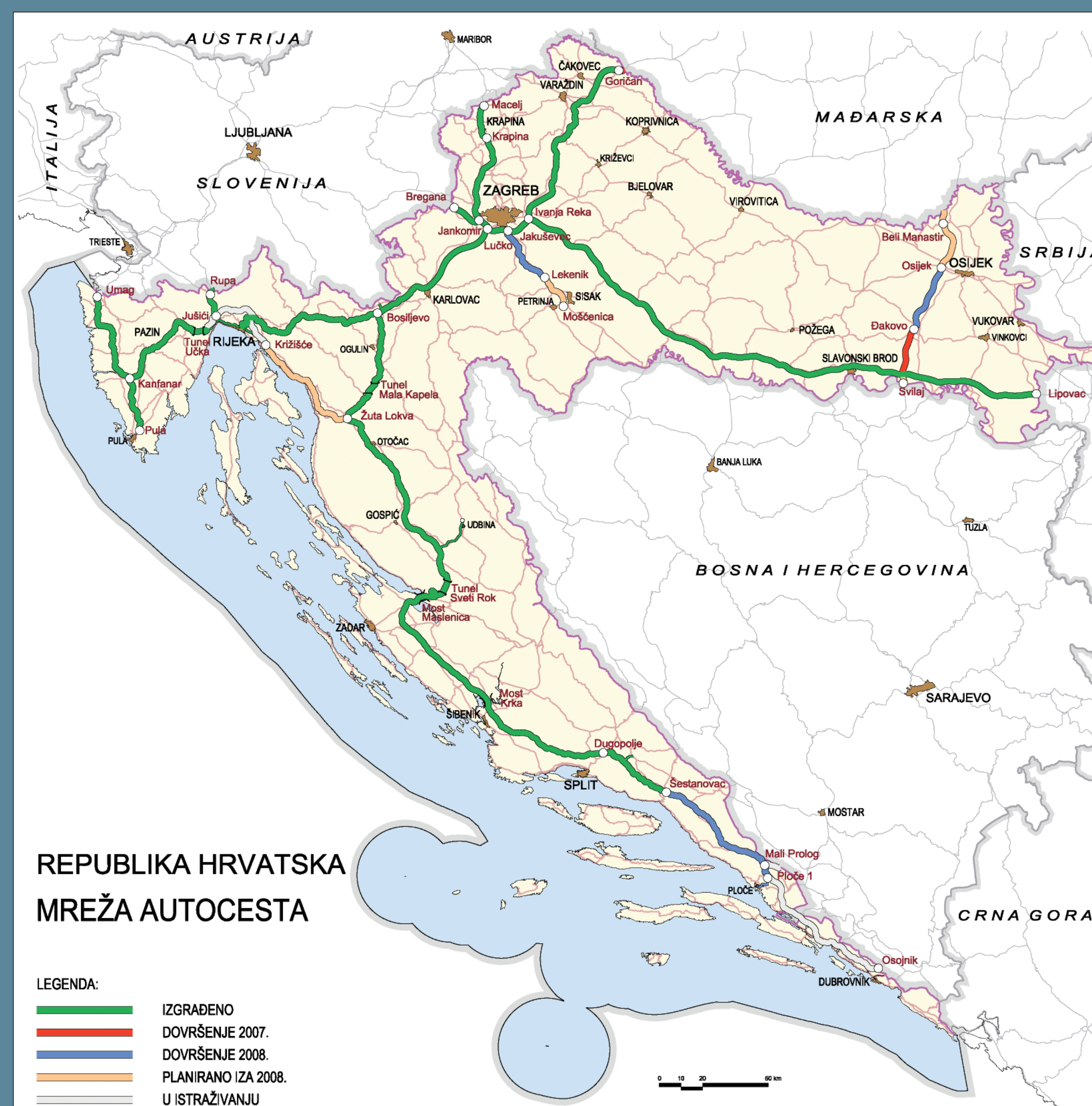
Mreža autocesta Republike Hrvatske do 2007.g.