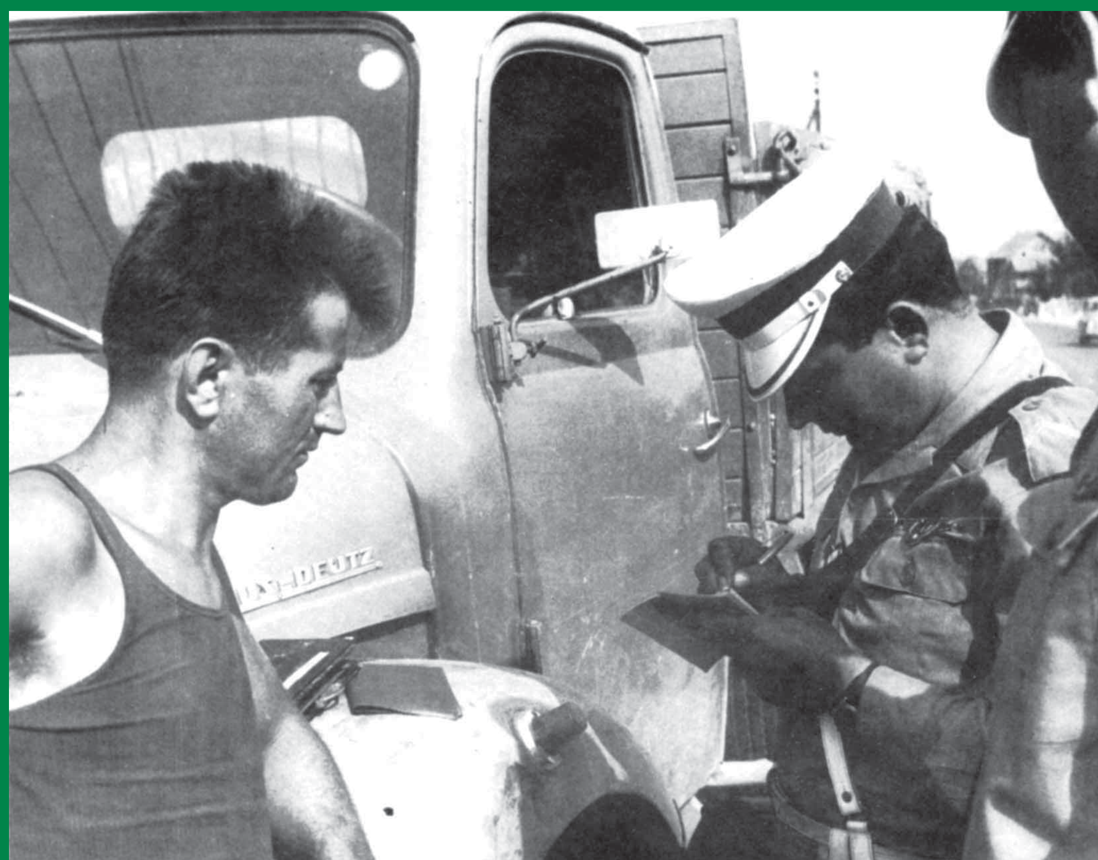
Policajci u nadzoru prometa, oko 1960. g.

Vozačka dozvola za vozače bicikla još nije zakonom propisana obveza, ali se traži da se djeca s navršениh devet godina osposobe za vožnju biciklom u školi i da im se za to izda odgovarajuća potvrda.