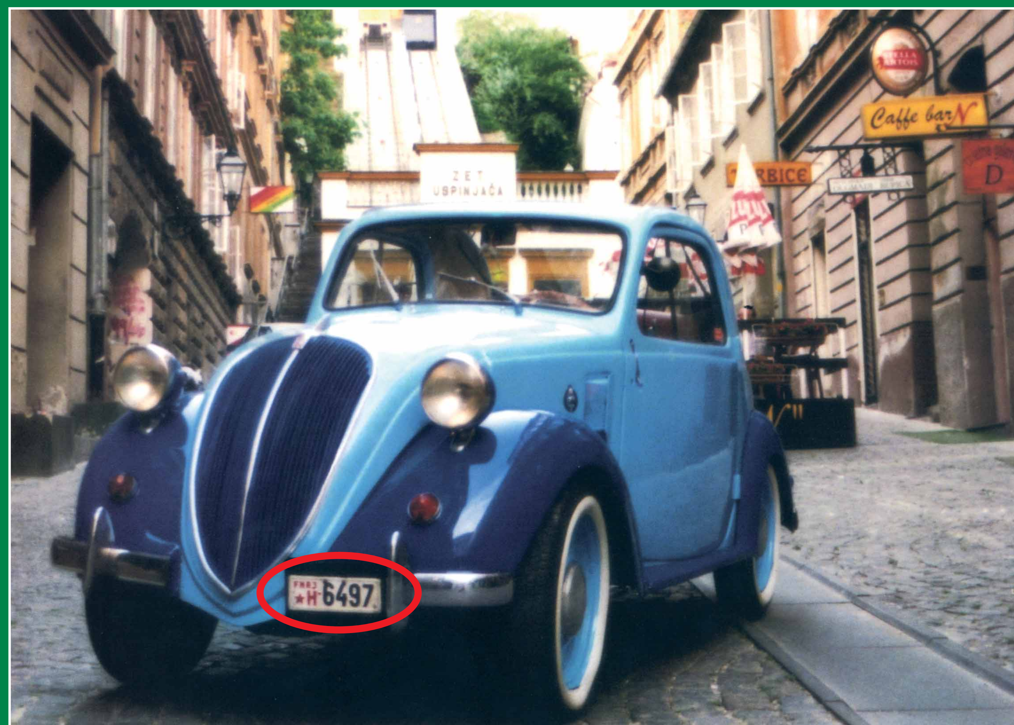
Fiat Topolino iz 1950. godine s registarskom oznakom.

Nakon II. svjetskog rata, do 1961. godine, registarske pločice nose oznaku po republikama (H za Hrvatsku, S za Sloveniju, C za Srbiju zbog ćirilicnog pisma). Te se godine mijenjaju propisi i registracijska područja se označavaju prvim početnim slovom i slovom iz naziva (npr. PU za Pulu, KŽ za Križevce), a registarski brojevi su bili brojčani. Između slovnih i brojčanih oznaka stajala je crvena zvijezda, što je pločicama davalo ideološku obojenost.