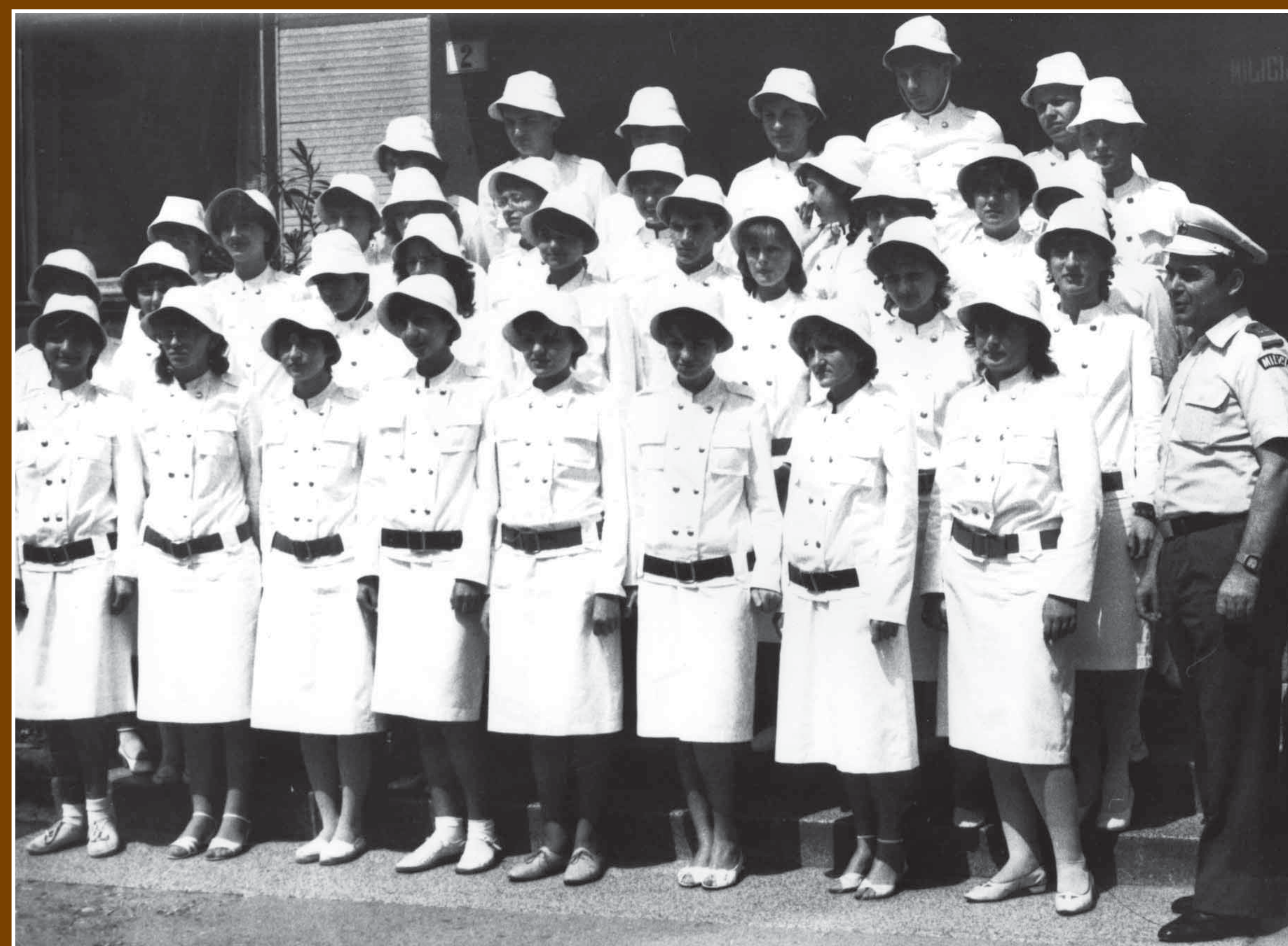
Pripadnici Vukovarske PJM

Kao i školske prometne jedinice i prometne jedinice mladeži pojavile su se dvadesetih godina prošlog stoljeća u SAD-u. Dok su u Berkeleyu, Kalifornija, bili zadovoljni njihovim radom jer nakon njihova angažiranja na prometnicama nije usmrćeno ijedno dijete, dotle se njihov rad u Washingtonu D.C. odvijao isključivo pod nadzorom policijskih službenika.