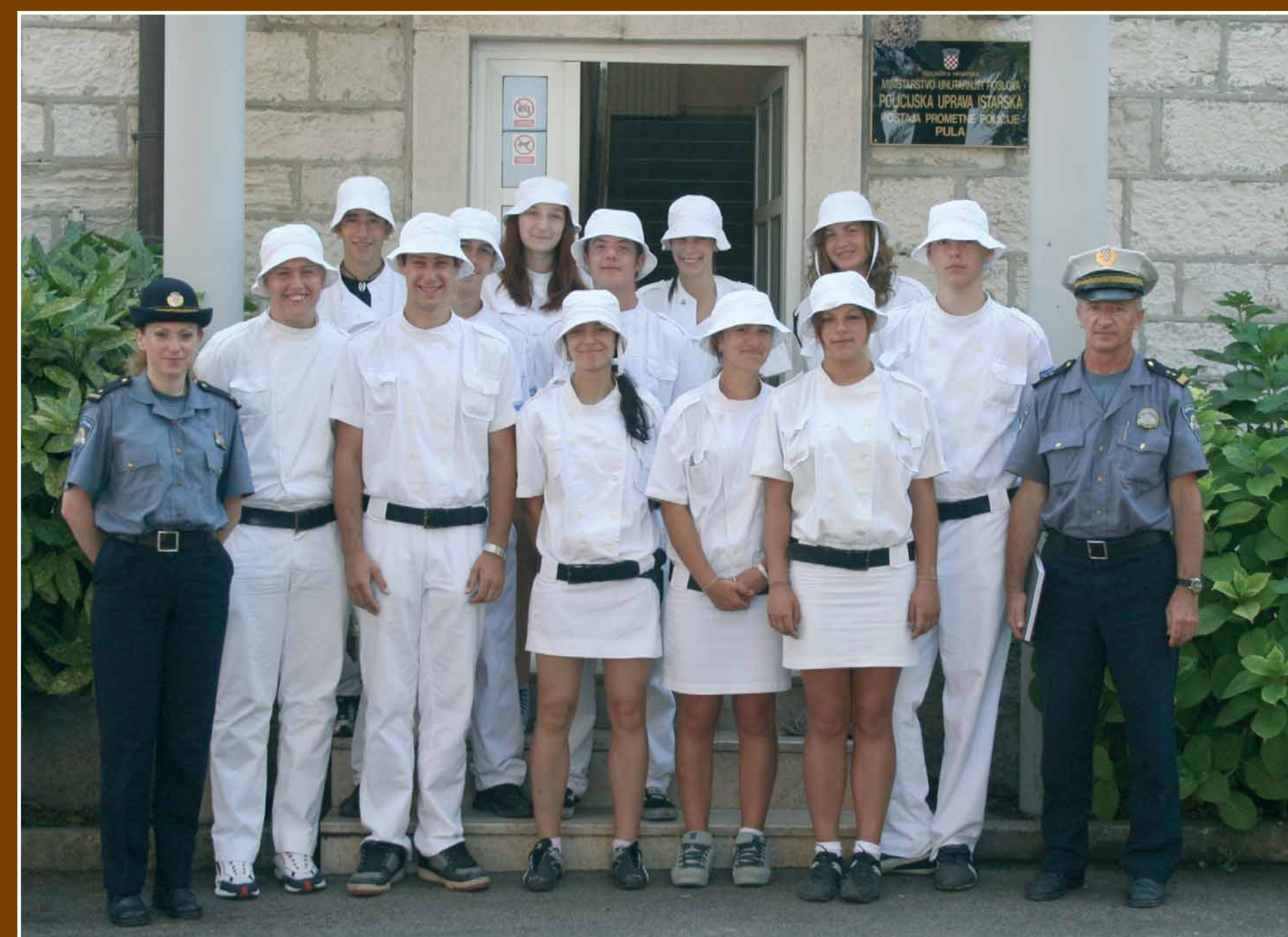
Pripadnici PJM Pula

Prometne jedinice mladeži djeluju u sklopu i pod nadzorom su policijske uprave na čijem su području organizirane. Pripadnici prometne jedinice mladeži mogu tijekom cijele godine obavljati poslove nadzora nepropisnog parkiranja, dostave te prometa pješaka, upravljati prometom na raskrižjima te sudjelovati u preventivnim aktivnostima, turistima davati temeljne obavijesti i biti im na usluzi, a njihov angažman ovisi o potrebama i mogućnostima lokalne zajednice. Ljetne odore su im bijele boje, a zimske su tamnoplave. Vrlo je važno da pripadnik jedinice mladeži govori barem jedan strani jezik i da poznaje značajnije objekte i institucije u mjestu u kojem je angažiran kako bi bio od koristi sugrađanima i gostima namjericima. Obično su njezini pripadnici studenti ili učenici završnih razreda srednje škole koji su za popunjavanje svog džeparca odabrali rad u prometnoj policiji.