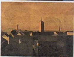
Lažni Murtić, Bakić, Lipovac i Stančić; Otisak koji reproducira ulje izvora Oreba "Lipo jutro sviće", napravljen suvremenom metodom ispisa ulja na platnu te dovršen s par poteza kista