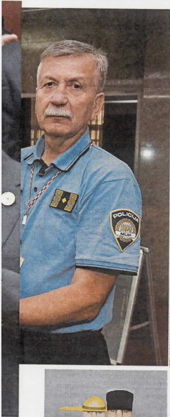
ZELJKO PUHOVSKI / HANZA MEDIA