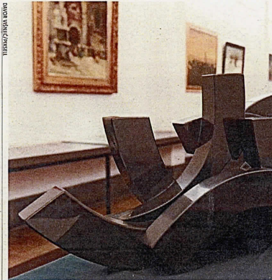
Krivotvorina granitne skulpture Dušana Džamonje 'MSG-XVII'

- To, dakako, nije uobičajena praksa, pa je rad poslan u Mimaruru na prosudbu, a potom i našem Centru za kriminalističko vještačenje, gdje je utvrđeno da je boja novovjekovna - kaže Jamičić dodajući kako u praksi krivotvorenja nema pravila - "štanca" se ono što se traži na tržištu. Često su to upravo umjetničke slike s kraja 19. st., poput Renoirove, ali i one sve do Drugog svjetskog rata. Pritom se uglavnom radi o manje ambicioznim umjetničkim radovima poznatih i polupoznatih autora, radi izbjegavanja pozornosti stručnjaka. Izbjegavaju se i atraktivne teme,